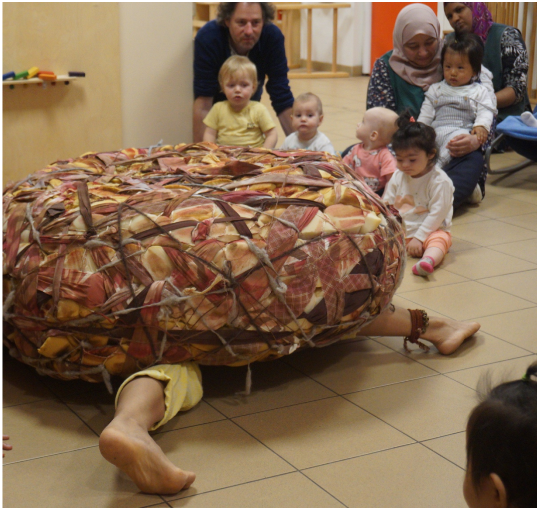
Photos : différents instants d'animations Nid Géant en crèche. Une animation Nid Géant – Œuf Géants a été aussi programmée en août 2022 dans le cadre de Park Poétik à Forest

Cette recherche a été soutenue par la Maison des Cultures et de la Cohésion Sociale de Molenbeek-Saint-Jean et Court'Echelle - lieu de rencontre enfants parents. Le Nid en mousse a été créé lors d'une résidence dans la crèche Le Nid d'Olina de Molenbeek-Saint-Jean et les animations avec le Nid Géant ont pris forme grâce aussi à la collaboration avec la cie sQueezz. Les animations autour du Nid Géant ont été déjà accueillies en 2022-23 dans les crèches Olina de Molenbeek-Saint-Jean, dans des crèches néerlandophones d'Anderlecht, à l'extérieur à Saint Gilles pour Park Poétik, au Festival Bout'Choux à Anderlecht et en salle à la MCCS de Molenbeek-Saint-Jean pour des crèches et au Studio Étangs Noirs pour tout public.