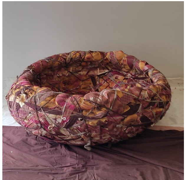
Images de la création progressive du nid, d'Oranne Mounition (mars 2022)